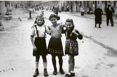
Kinder im DP-Camp Föhrenwald (vor 1949)