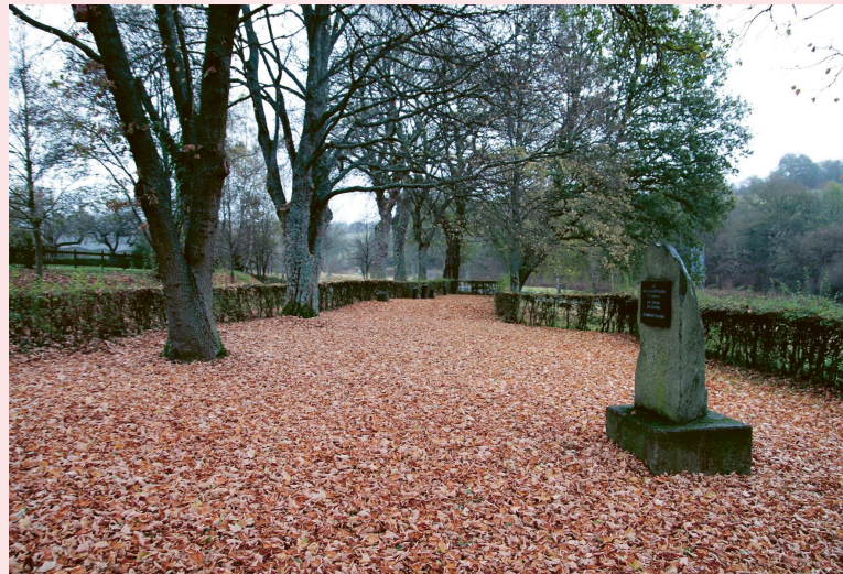
Der jüdische Friedhof in Thalfang

Es gibt aber leider auch ganz andere Beispiele. In Thalfang, Kreis Bernkastel, an der grossen Auffahrtsstrasse zur Saar liegt ein alter, verlassener jüdischer Friedhof, der 10 nur durch die Initiative eines Freundes, der sich von Trier aus um die Rückerstattung jüdischen Gemeindegutes bemüht, wieder als solcher kenntlich ist. In Thalfang lebt kein einziger Jude mehr. Der Friedhof war [1938] beim Bau der Autostrasse in zwei Teile geteilt worden, die Grabsteine 15 wurden verstreut in verschiedenen Bauernhöfen gefunden