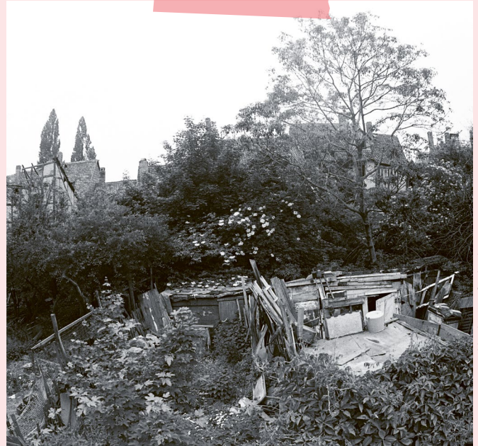
Blick auf den ehemaligen Standort der Halberstädter Synagoge, 1987

Gegenüber auf der Bakenstraße, wo sich einst der Eingang zur Synagoge befand, klingelte ich an dem dazu