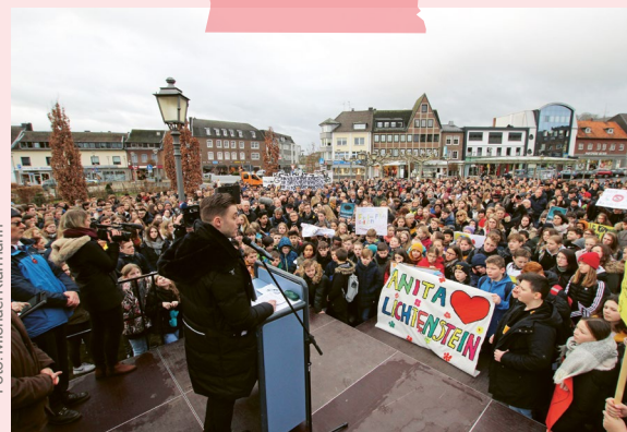
Kundgebung gegen Antisemitismus in Geilenkirchen, 27. Januar 2020

Aus: Pressemitteilung (Oktober 2021), in: „Konsequente Rechtsprechung sieht anders aus“, hg. v. RIAS Nordrhein-Westfalen, Düsseldorf 2023, S. 15 (online).