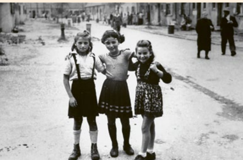
Kinder im DP-Camp Föhrenwald (vor 1949)